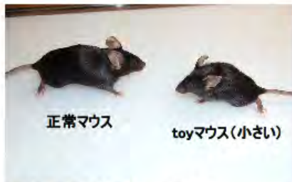
図1 正常マウスと toyマウス 5ヶ月齢のtoyマウスの体重は、正常マウスの体重の約半分である。