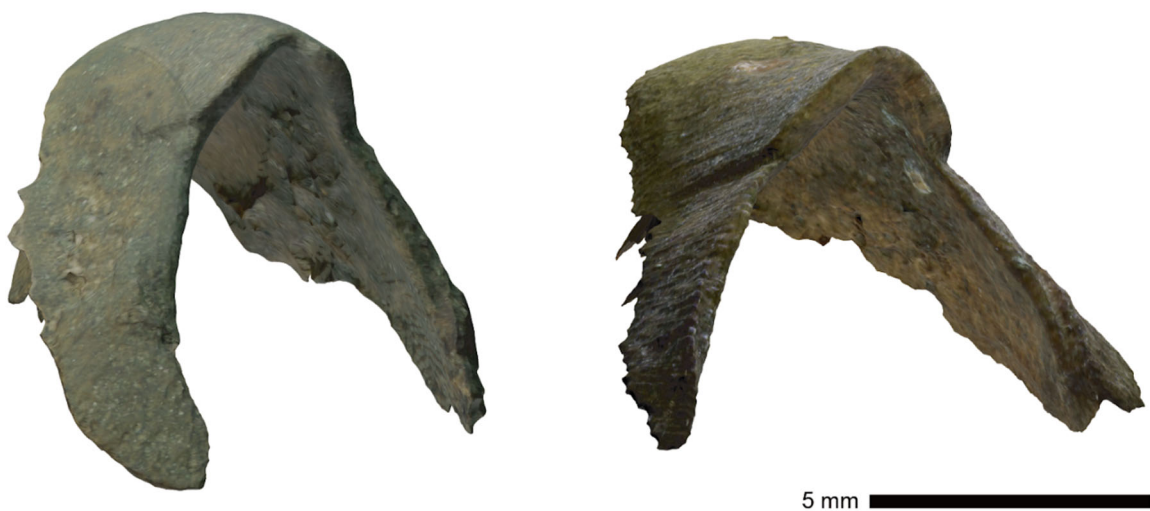
図 3. 発見された新属新種「 Uluciala rotundata (ウルシアラ・ロツンダータ)」の下クチバシ化石。7,400 万年前の標本 (左) と 6,700 万年前の標本 (右)。3D モデルはオンラインで自由に保存・観察が可能 ( https://doi.org/10.6084/m9.figshare.28119998 )。